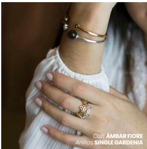
Cuff ÁMBAR FIORE Anillos SINGLE GARDENIA